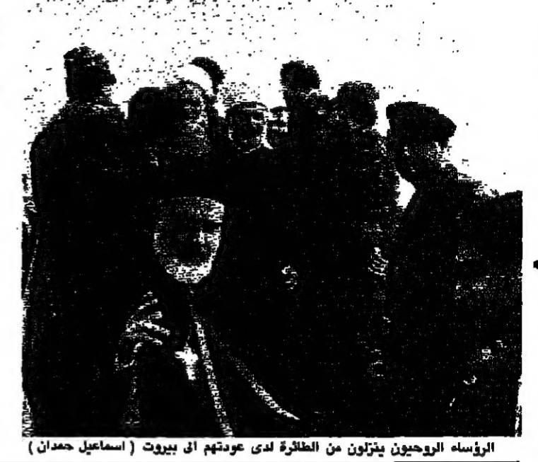
الرؤساء الروحانيين يترأسون من الطائفة لدى عودتهم الى بيروت (اسماعيل حمدان)

نتيجة وزير خارجية الكويت الشيخ صباح الاحمد الصباح الى دمشق في الازمة اللبنانية للجنة لقيادة الرئيس حافظ الأسد ووضعه في اجواء تتخلل اجتماعات اللجنة العربية السادسة مع القيادات الروحية اللبنانية. وسيدخل الشيخ صباح بشكل خاص في فكرة تطعيم قوات الردع السورية بعناصر عسكرية رمزية تابعة لدول اللجنة السادسة. وكذلك في تفاصيل الانسحاب السوري من منطقة بيروت الادارية لتتسلم الولاية الجيش اللبناني المهتم الامنية. وكان الصباح قد أعلن في مؤتمر صحفي عقبه، بعد انتهاء أعمال اللجنة العربية السادسة في الكويت، ان الوجود السوري في لبنان، تم تنفيذ القرار العربي، وان الاحتلال الاجنبي لهذا البلد، هو الاحتلال الاسرائيلي فقط. واضاف الصباح ان ما حدا لم يطلب من الجيش السوري الخروج من لبنان، الا خلافاً لقرار مجلس العربية في ايلول ١٩٨٢ على ان يكون ذلك بالتشاور بين الحكومتين اللبنانية والسورية. وأكد ان السوريين سيخرجون من لبنان عندما تكون هناك سلطة وحكومة ووافق وطني. واشار الوزير الكويتي من ناحية ثانية الى ان الرئيس الاسد اعرب له خلال زيارته لدمشق، عن دعمه لهمة لجنة المساعي الحميدة، ولى ان البيان السوري - السوفياتي المشترك، الذي نشر في ختام الزيارة الاخيرة التي قام بها وزير الخارجية السوفياتي اواردي شيفاردينازه لدمشق بحضور مندوبين ايضا دعما للجنة. وقال رئيس اللجنة العربية انه متفائل بشأن حل الازمة السياسية التي يواجهها لبنان. وذكر الشيخ صباح الاحمد ان الزعماء اللبنانيين اتفقوا على الحل في اثناء الحرب الاهلية التي بدأت منذ ١٤ عاما تقريبا. وعلى اجراء اصلاحات سياسية والحفاظ على وحدة لبنان وسيادته. وقال بعد محادثات استمرت يومين فلما نحن متفكرون... ويايتها تقالوا اكثر بما